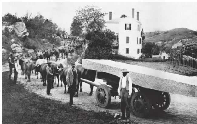
Přesun žulového bloku 30 voly. Rockport, Massachusetts circa 1870