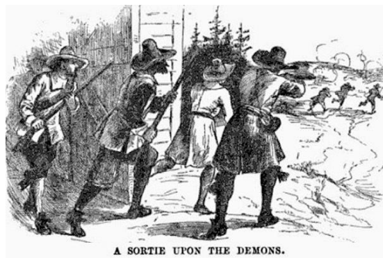
Výprava na demony

Tento příběh o přízracích z Gloucesteru v Massachusetts z roku 1692 byl vyprávěn z tolika zdrojů naznačující tak, že kolonie trpěla masovými pověrami. Uprostřed obvinění z čarodějnictví v roce 1692 se objevil nový fenomén satanského běsnění. Do Gloucesteru vtrhla rota přízraků mající zjev Indiánů nebo Francouzů. Tyto přízraky přicházely z bažin nebo kukuřičných polí, někdy jednotlivě, jindy zase ve skupině. Mnohokrát se přiblížily i k posádce. Obvykle vojáci zmeškali palbu, ale když zbraně vystřelily, kulky neměly žádný účinek. Reč těchto zjevů byla v neznámém jazyce. Nosili zbraně a skutečné náboje z nich vystřelené dolovali dokonce i ze stromů. Poplach byl v Gloucesteru tak velký, že major Samuel Appleton z Ipswiche vyslal 18. července asi šedesát mužů na pomoc proti těmto nevysvětlitelným zjevením. Osady v Gloucesteru trpěly těmito poplachy po dobu asi čtrnácti dnů.